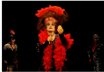
El regreso de la vieja dama