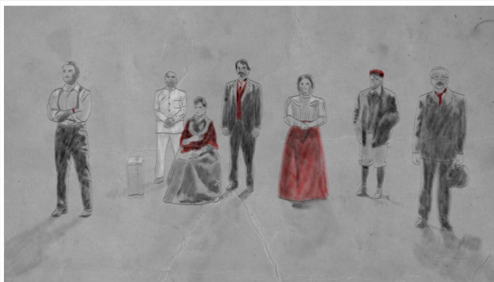
Dibujo de promoción de “Hierro”, obra de Omar Batista (cortesía de Arca Images).

Al desacralizar la figura marmórea, terminas recolocándolo en una posición muy alta, comenta Celdrán. “Porque cuando ves a un hombre con esos sufrimientos, con esos delirios, con esas fiebres, que a la vez llegó a construir todo lo que construyó, te preguntas cómo en 42 años de vida pudo hacer todo lo que hizo”.