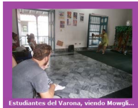
Estudiantes del Varona, viendo Mowgli...

En la tarde del 23 de septiembre se llevó a cabo un productivo intercambio entre estudiantes del 2do año de la especialidad de Teatro, que cursan la Licenciatura en Educación: Instructor de arte, en la Universidad de Ciencias Pedagógicas Enrique José Varona, de La Habana, y los intergrantes de Teatro La Proa, en la sede de nuestro grupo.