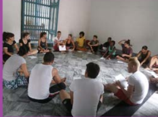
Taller con adolescentes y jóvenes.