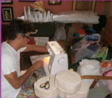
Creando los nuevos títeres.