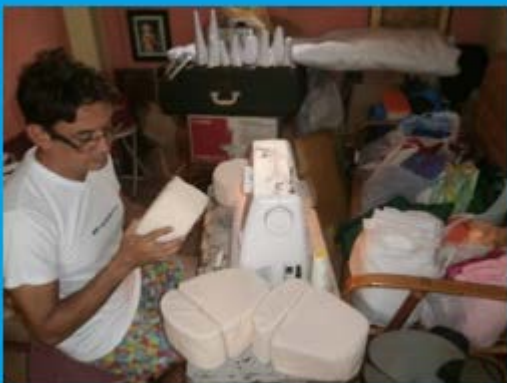
Elaboración de los nuevos títeres.