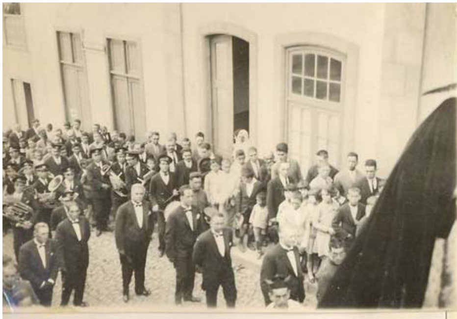
procesión del año 1930 por la calle del Agua, donde se aprecia la casa nº 23 del abuelo materno y donde viviera Adela Escartín Ayala.