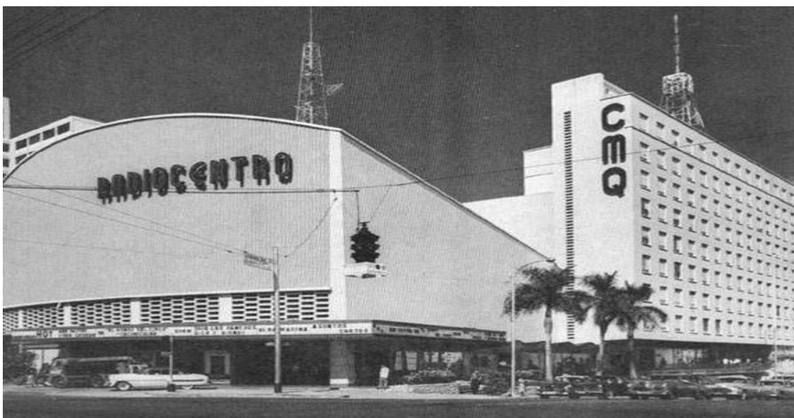
Foto de la Radio CMQ de La Habana (Cuba).

En 1952 regresa a La Habana (Cuba), donde ya había ido como actriz invitada en varias producciones teatrales. Desde 1952 a 1959 trabaja ininterrumpidamente como primera actriz en teatro, radio y televisión (actriz exclusiva de CMQ), en empresas privadas y en su propia Sala: Prado 260.